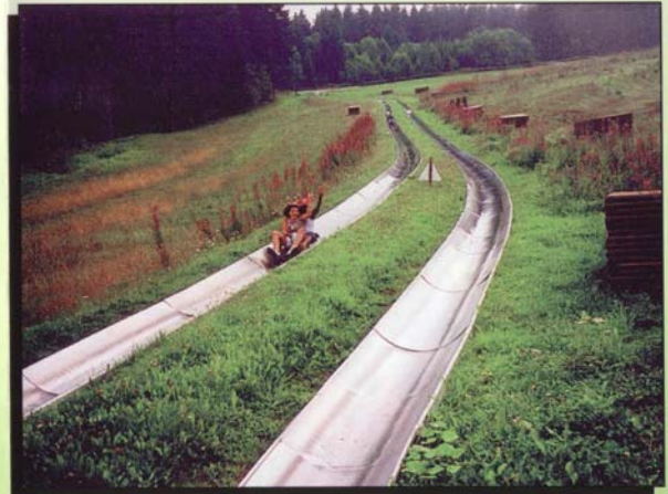
2 x 700 m Sommerrodelbahnen auf der Wasserkuppe ... und zurück geht's mit dem Schlepplift.

Sommerrodelbahnen sind ein ideales Ziel für Schul-, Vereins- und Familienausflüge in die Rhön und den Vogelsberg.