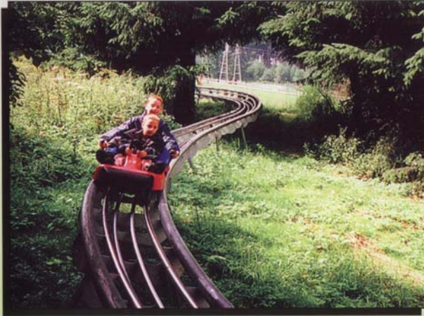
Faszination Geschwindigkeit auf dem Rhönbob

In schöner Natur haben Sie Gelegenheit, auf den Sommerrodelbahnen rasant ins Tal zu rauschen. Dabei müssen die Sommerrodler keine Könner sein, denn es ist ein ungefährliches Vergnügen, wenn Sie die einfachen Regeln einhalten. Und die haben Sie rasch gelernt. Schon nach einigen Abfahrten sind Sie ein perfekter Rodler.